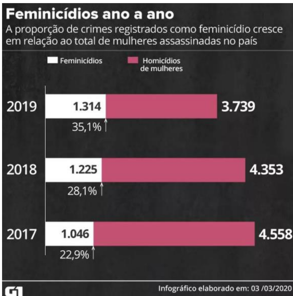
Figura 3. Feminicídios entre os anos de 2017 a 2019

E, pior do que o aumento dos casos de violência doméstica, são as alarmantes taxas de feminicídio em nosso país, que ao invés de diminuir, só crescem, como se observa no infográfico elaborado no dia 03/03/2020, pelo site G1, que demonstra que o número de feminicídios representa uma porcentagem de 35,1 % do número total de mulheres mortas no País, só pelo fato de serem mulheres, como vemos abaixo: