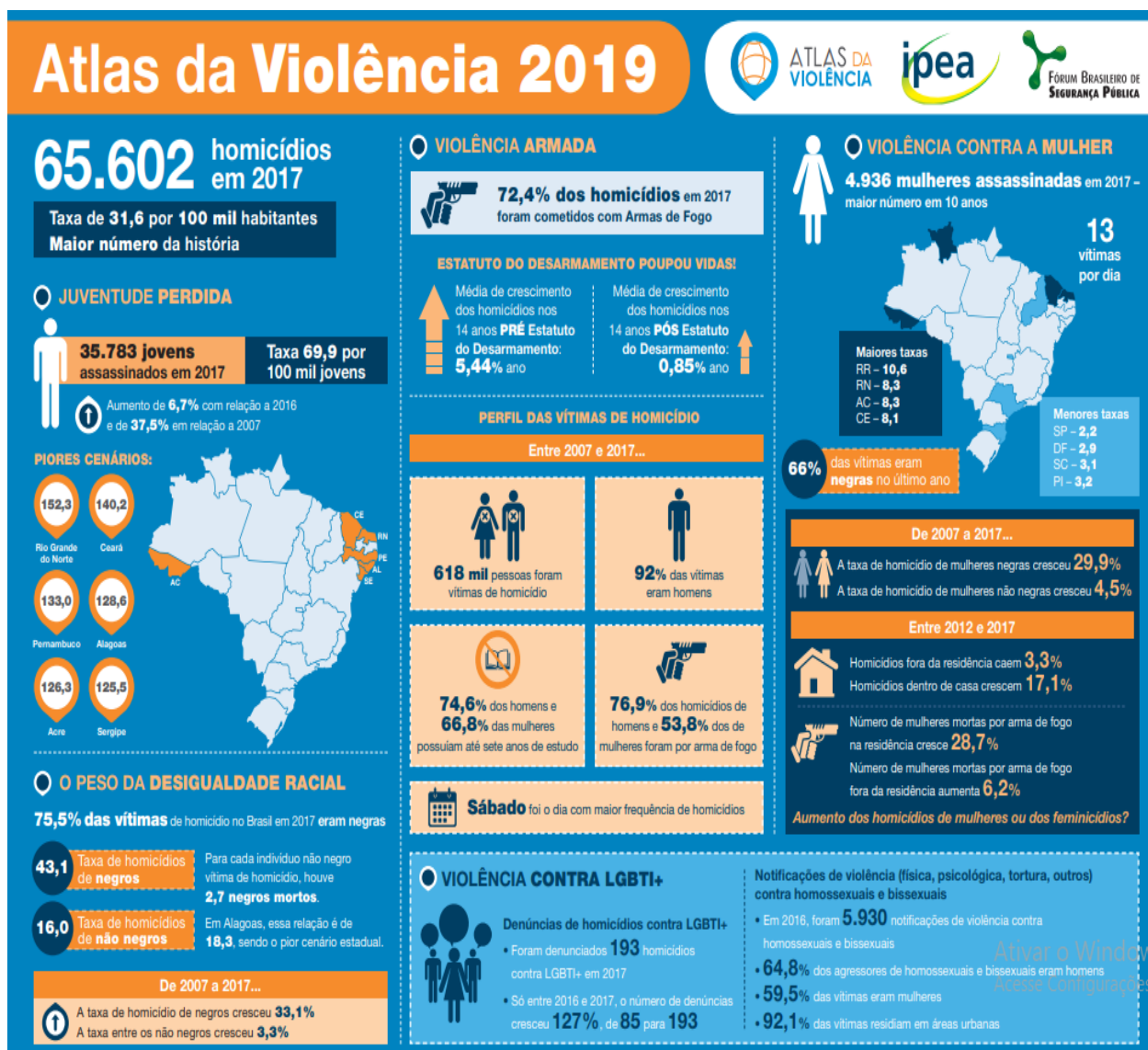
Figura 1. Atlas da Violência 2019